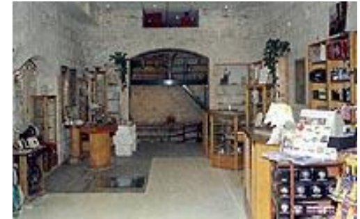
Ingang langs de galerij

Uw verblijf in de stad van Nazareth zou onvolledig zijn zonder een bezoek aan het Oude Badhuis, een unieke kans om het leven te ervaren zoals het was in de tijd van Christus.