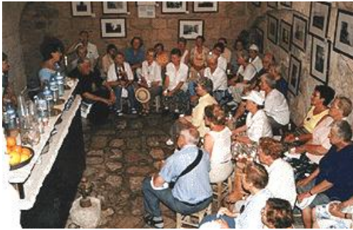
Groepslezing in de kelder