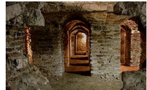
De hypocaust ontdekkten

In de Arabische taal beduid "Saber" eveneens: geduld, volharding en uithoudingsvermogen.