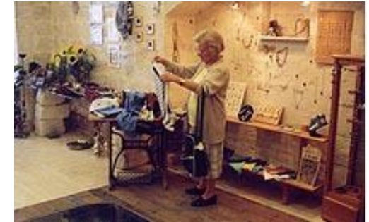
Winkelen in het caldarium

Vandaag kunt u genieten van een geleid bezoek in "Cactus": het calidarium (de warme ruimte), de mooiste hypocaust van het Midden-Oosten (de ondergrondse verwarmingsruimte) en de praefurnarium (de stookplaats). Na de rondleiding wordt u een verfrissing aangeboden in de rustgevende overwelfde kelder, waar U kan genieten van een permanente tentoonstelling van de uitgravingen van het badhuis. Vroeger werd deze ruimte gebruikt als opslagplaats voor het stookhout.