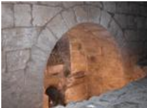
Oven van het badhuis

De rondleidingen omvatten een bezoek in al de uitgegraven ruimte, evenals een verslag over de geschiedenis van het gebouw en het uitgravingsproces.