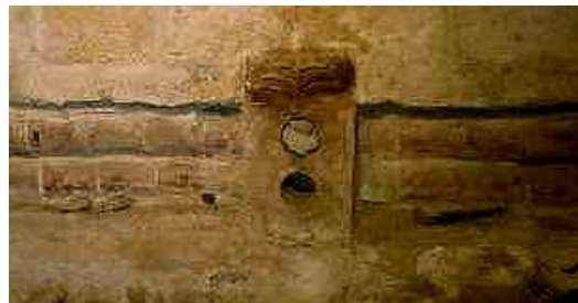
Originele kleien leidingen